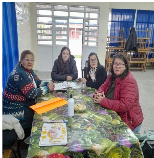
Visita a la EPEP N° 51. Modalidad EIB.