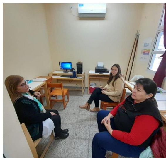
Charla con la directora y una docente de la EPEP N° 127.