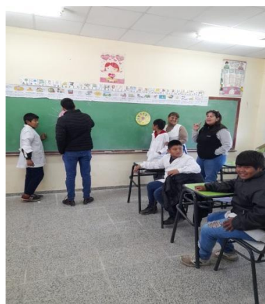
Integrantes del equipo realizando las actividades propias de ayudantía.